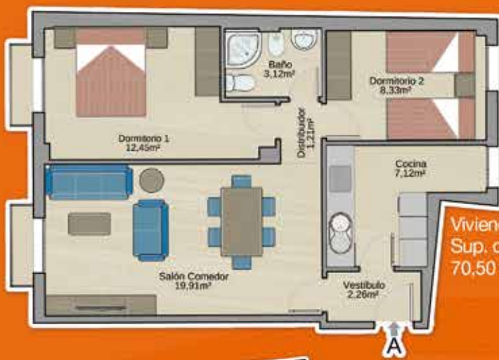
Vivienda A (2 dorm.) Sup. construida: 70,50 m 2