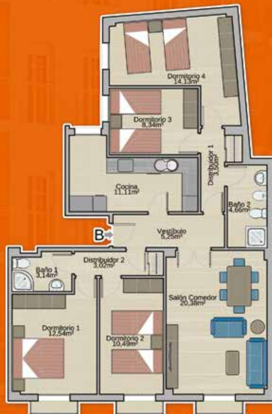
Vivienda B Sup. Construida: 125,20m²