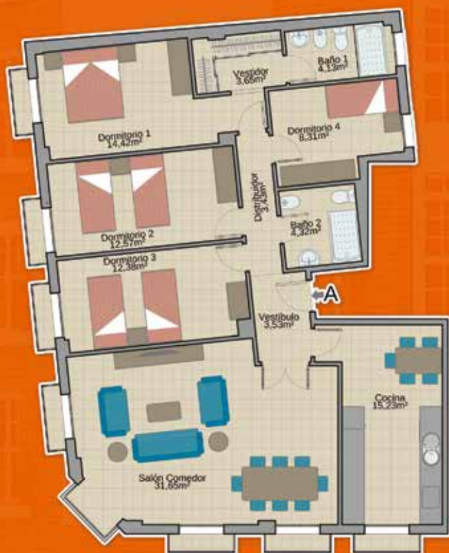
Vivienda A (de esquina) Sup. Construida: 146,67m²

La información contenida en el presente folleto es facilitada por el propietario de las viviendas anunciadas, no siendo responsable por tanto, BAYONUBA INMOBILIARIA, S.L. de cualquier cambio, error y/o modificación que sobre las mismas puedan producirse, reservándose esta el derecho a dar por concluida la oferta de publicidad sin necesidad de previo aviso en cualquier momento.