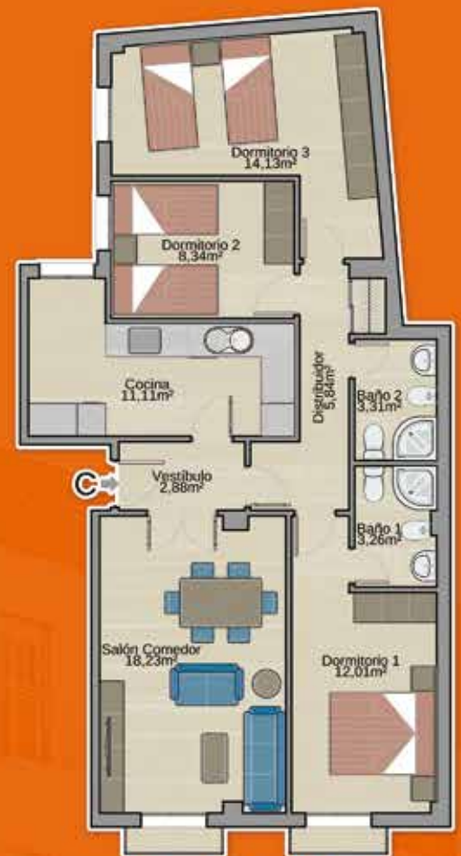
Vivienda C (3 dorm.) Sup. cons: 102,53 m 2