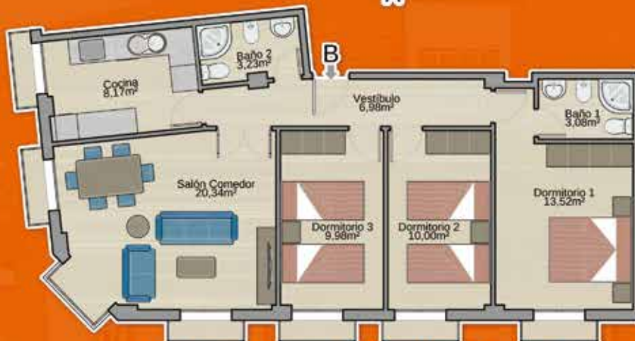
Vivienda B (3 dorm. de esquina) Sup. construida: 97,59 m 2